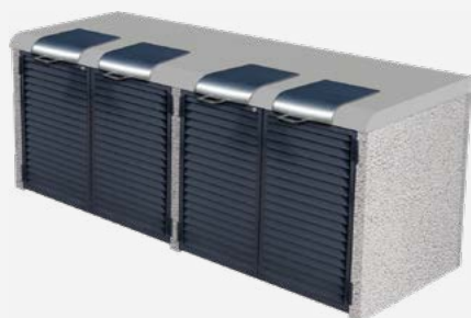
béton finition sablé gris