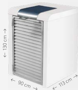
Béton finition blanc poli