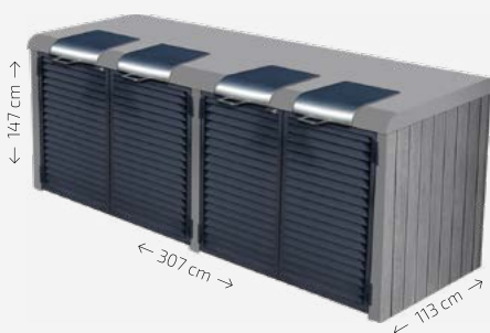
Béton finition matricé bois vertical gris