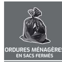
Signalétique OM, emballages, verre, papiers