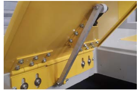
Trappe équipée d'un amortisseur