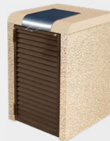
Béton finition sablé beige

Usage : Extérieur Nombre de bacs : 1 à 4 Poids : à partir de 1 tonne