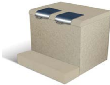
Marche devant l'abri