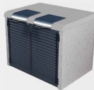
Béton finition grainé teinté gris