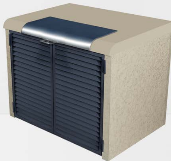
Lucia Béton finition grainé teinté beige