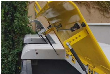
Trappe gros producteur